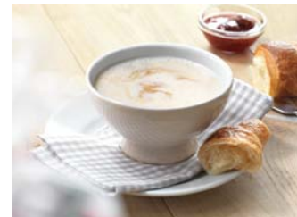
Café au lait - Tejeskávė