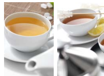
Zöld tea / Fekete tea