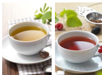
Gyógytea / Gyümölcstea