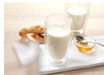
Forró tej /Tejhab